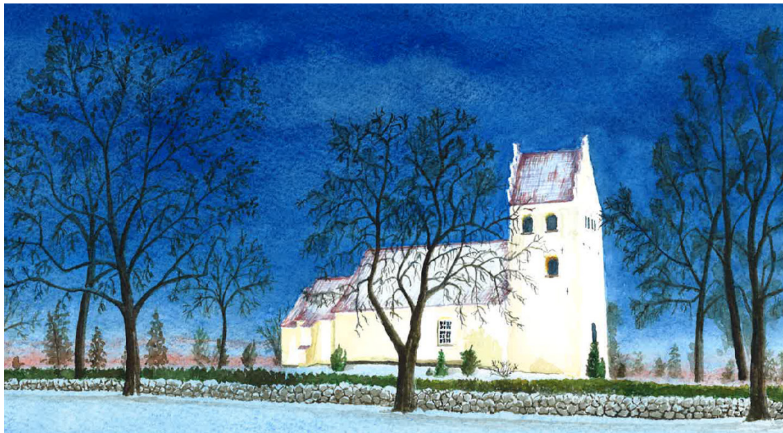
Maleri af lokal kunster: Flemming Schrøder